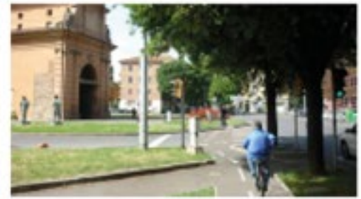
Tangenziale delle Biciclette, Porta Lama