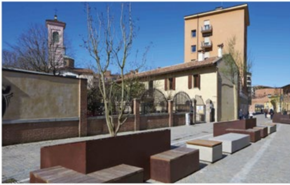
via Azzo Gardino pedonale