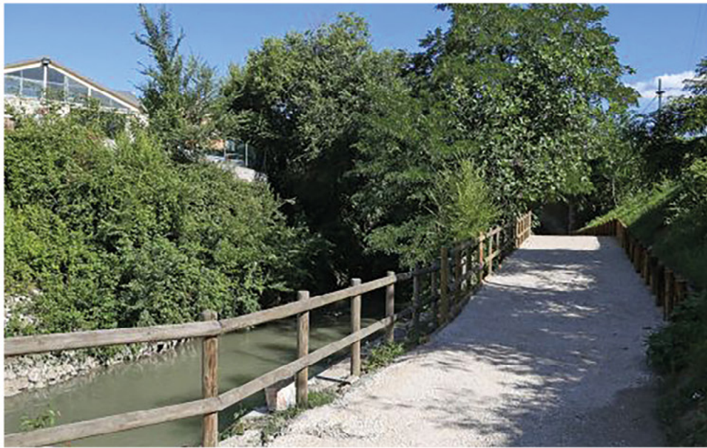
Percorso ciclopedonale Lungo Navile