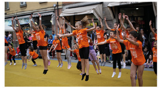
Festa di strada in via Corticella