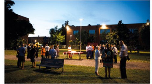
Nuova illuminazione pubblica