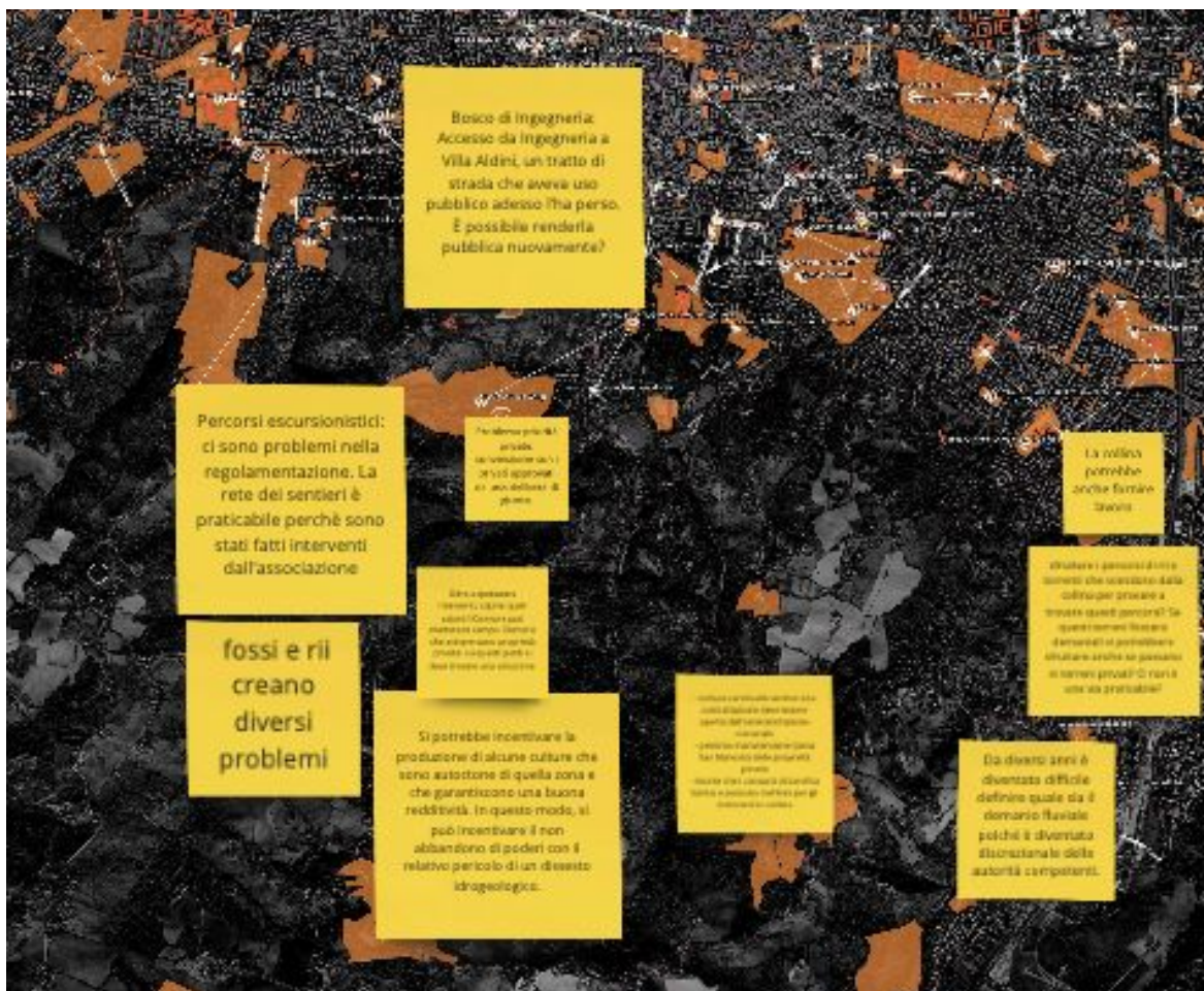
Fig. 4 Visualizzazione della fase di confronto - Zona Osservanza-Paderno