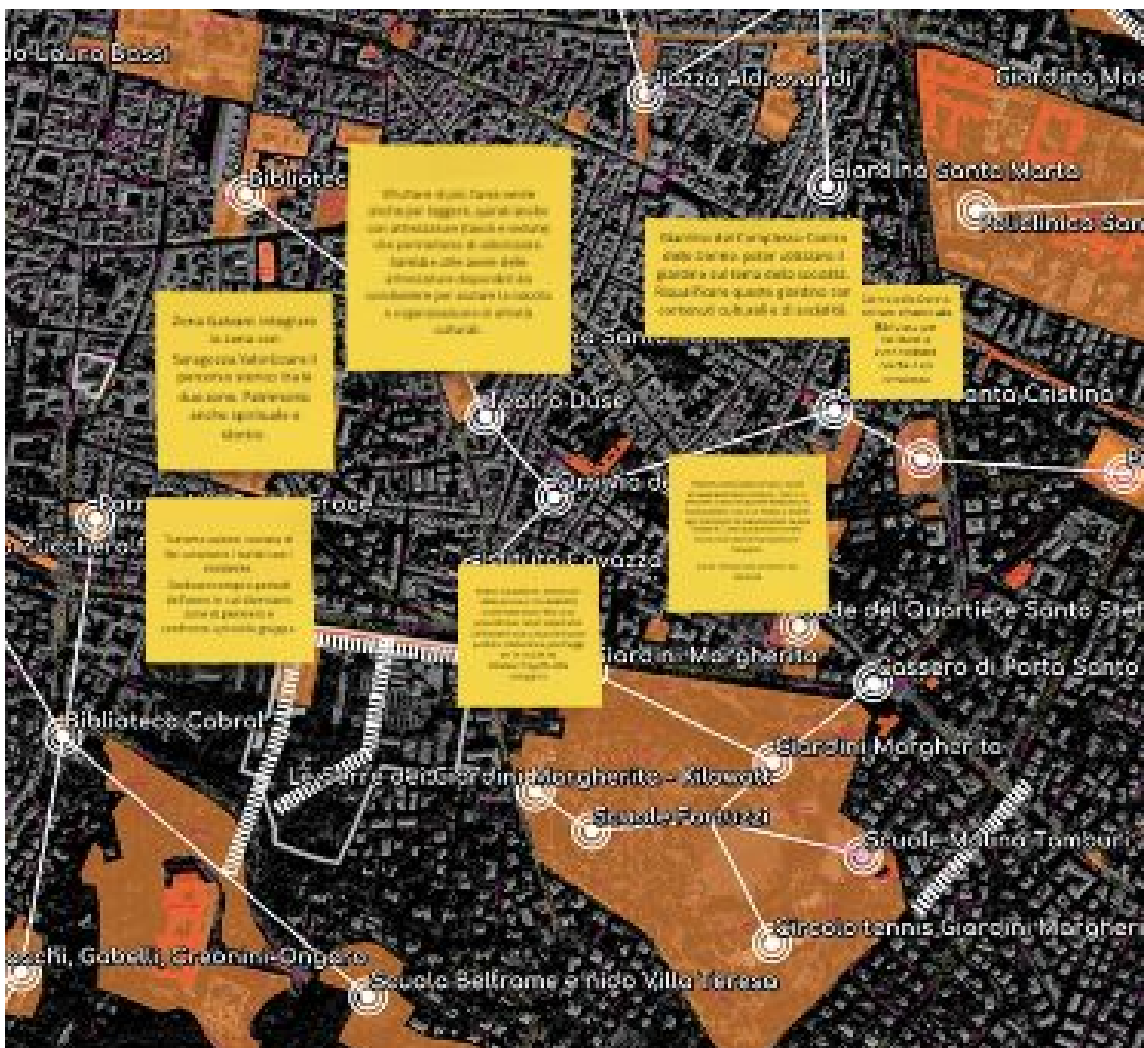
Fig. 3 Visualizzazione della fase di confronto - Zona Galvani