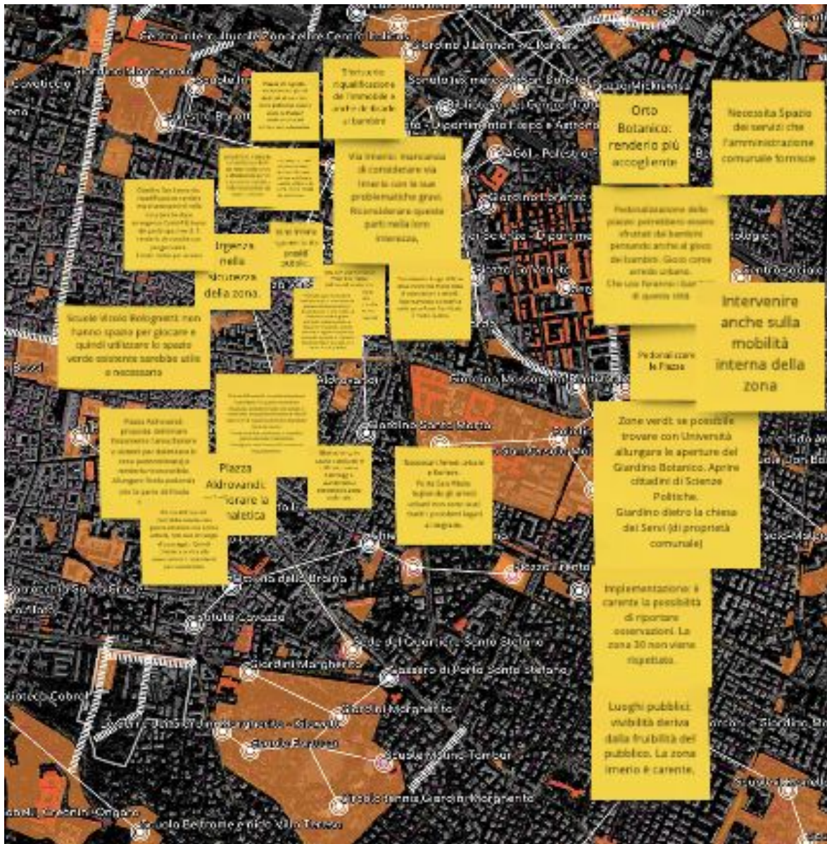
Fig. 2 Visualizzazione della fase di confronto - Zona Imerio