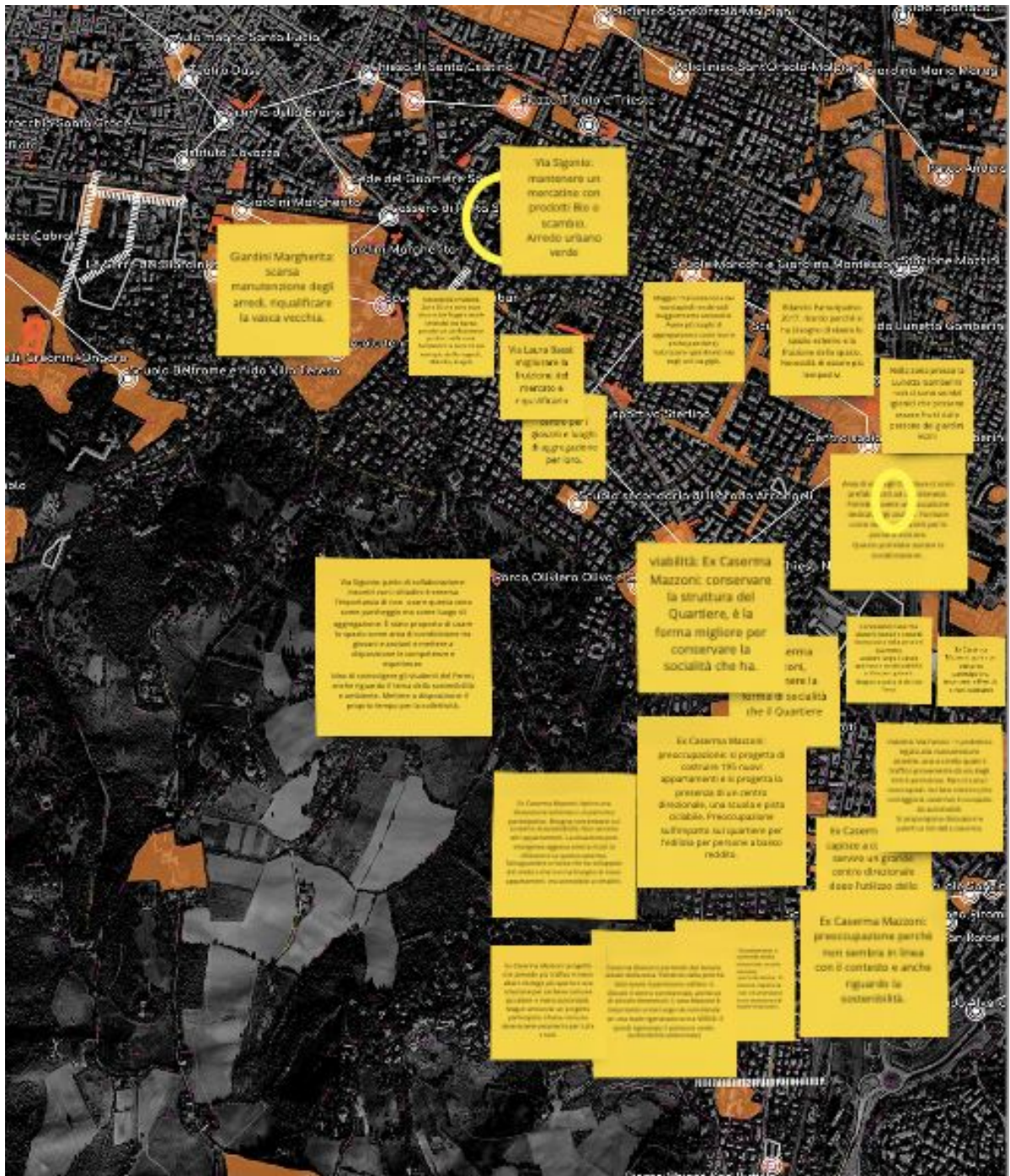
Fig. 1 Visualizzazione della fase di confronto - Zona Murri - Lunetta Gamberini